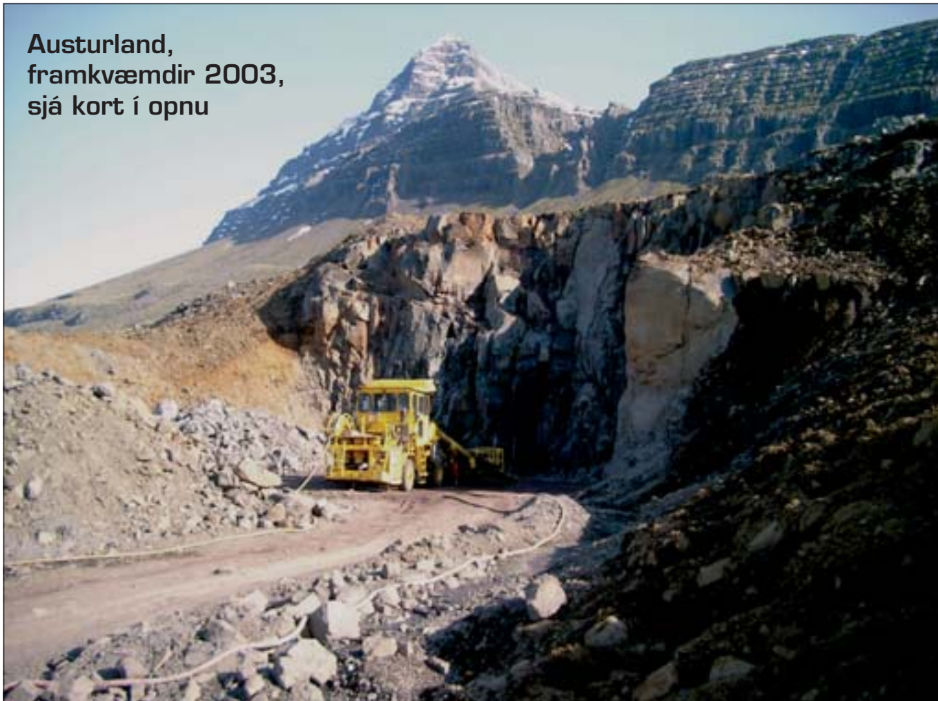
Munnasvæði í Reyðarfirði.

Austurland, framkvæmdir 2003, sjá kort í opnu